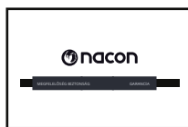
1 Garanciával és megfelelőséggel kapcsolatos dokumentum