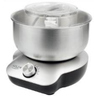
MIXER WITH BOWL AD 4222