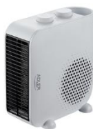
FAN HEATER AD 7725