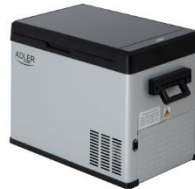
PORTABLE FRIDGE AD 8077