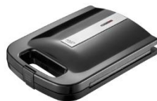
Sandwich Maker AD 3055