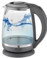
ELECTRIC KETTLE AD 1286