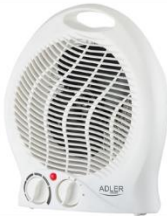
FAN HEATER AD 7728