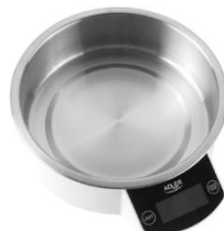
KITCHEN SCALE AD 3166