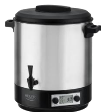
PASTEURIZATION POT AD 4496