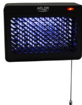
MOSQUITO LAMP AD 7938