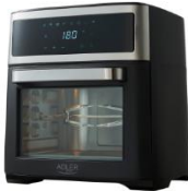
AIR FRYER OVEN AD 6309