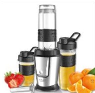
PERSONAL BLENDER AD 4081