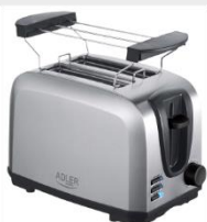
TOASTER 2 SLICE AD 3222