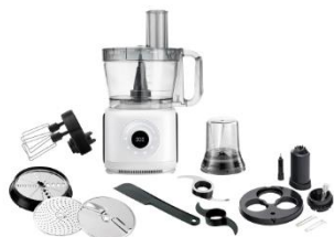
FOOD PROCESSOR AD 4224