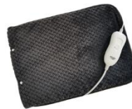
HEATED PAD AD 7433