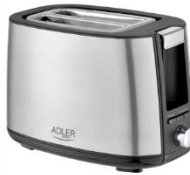
TOASTER 2 SLICE AD 3214