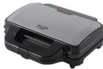
SANDWICH MAKER AD 3043