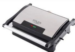
ELECTRIC GRILL AD 3052