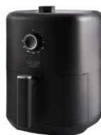
AIR FRYER AD 6310