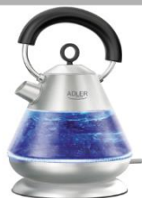
Electric Kettle AD 1282