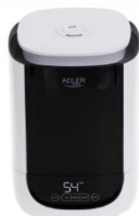
AIR HUMIDIFIER AD 7966