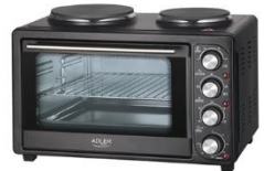
Electric Oven With HOB AD 6020