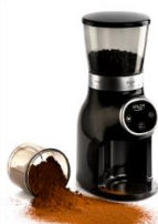
Burr Coffee Grinder AD 4450