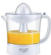
CITRUS JUICER AD 4009