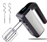
MIXER AD 4225