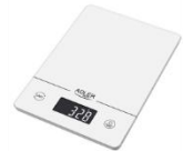
KITCHEN SCALE AD 3170