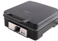
WAFFLE MAKER AD 3049